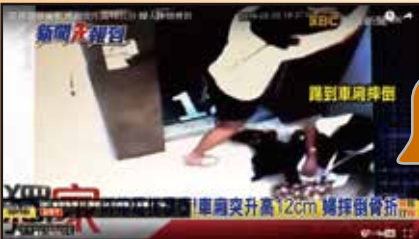
2016-5-30 (屏東) 再傳電梯暴衝 車廂突升高 婦摔倒骨折