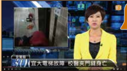
2016-5-23 (宜蘭) 電梯故障,校醫夾門縫身亡