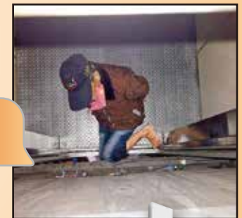
2014-12-16 (桃園) 恐怖電梯夾腿 女兒救父摔死

歐、美、日、韓、新加坡、香港、中國等國家都已立法， 電梯必須加裝暴衝防治系統(UCMP)