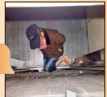
2014-12-16 (桃園) 恐怖電梯夾腿 女兒救父摔死

歐、美、日、韓、新加坡、香港、中國等國家都已立法， 電梯必須加裝暴衝防治系統(UCMP)